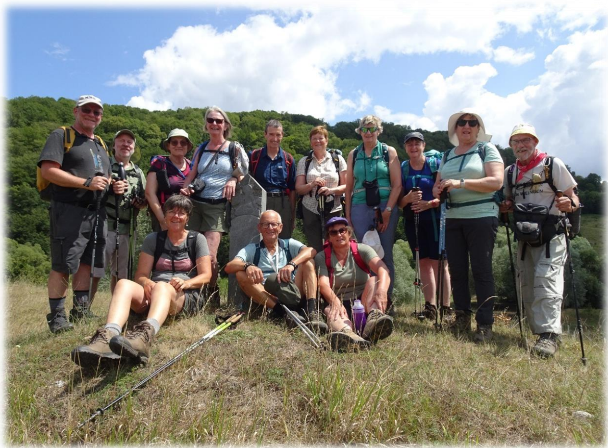
Bij het begin van de reis hebben we een groepsfoto gemaakt aan de eerste borne die we zijn tegengekomen. Nu maken we ook een groepsfoto aan de laatste borne.