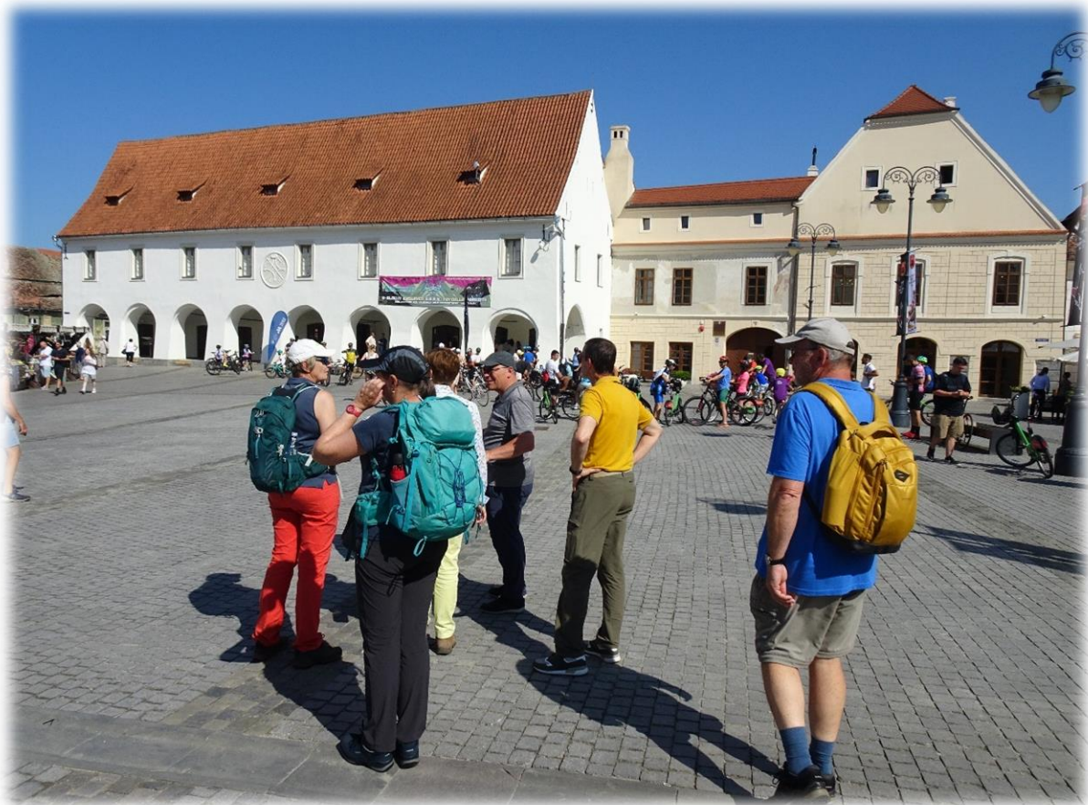
Sibiu was samen met Luxemburg in 2007 Culturele hoofdstad van Europa. De keuze voor deze combinatie werd gemaakt omdat de oorspronkelijke Saksen in Transsylvanië uit het