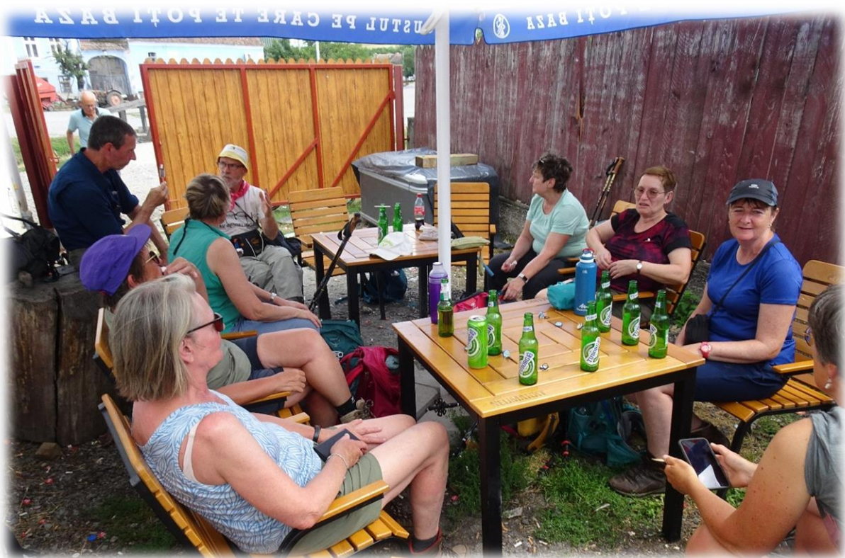
Een terrasje mag uiteraard niet ontbreken op het einde van de dag. We hebben het allemaal verdiend.