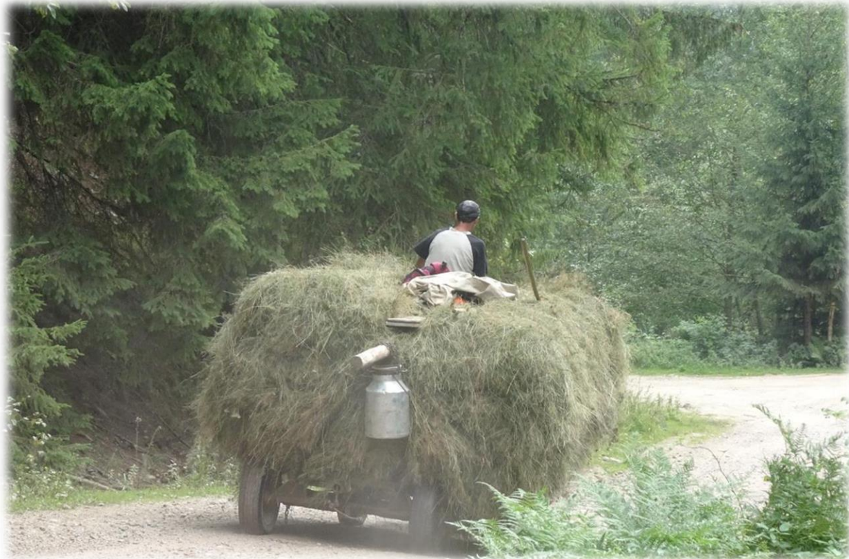
Een plaatselijke boer heeft zijn kar flink geladen met hooi. De balk in het midden (waar een melkkan aanhangt) zorgt ervoor dat het hooi blijft liggen.