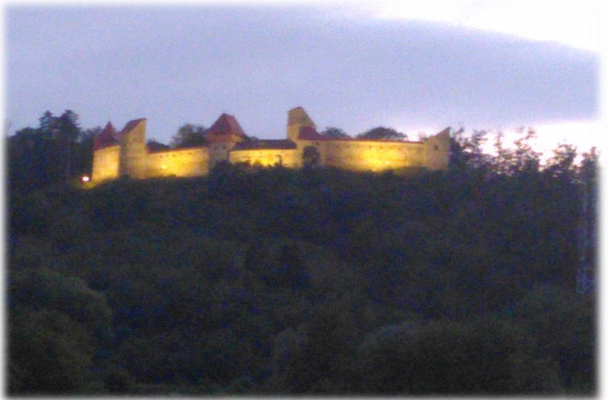
Vanuit ons hotel hebben we zicht op de gerestaureerde burcht van Saschiz.